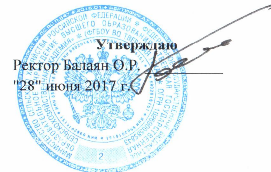
График одобрен Ученым советом вуза 28.06.2017 г. протокол № 15